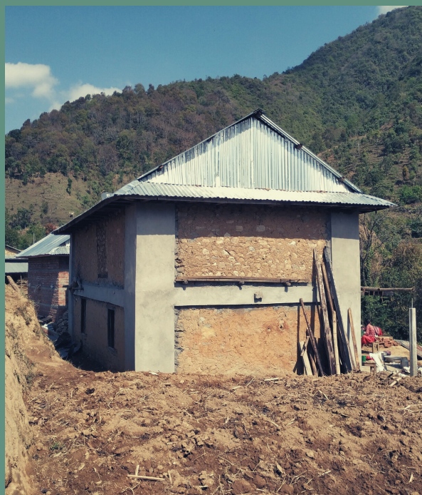
Casa reforzada por Awasuka. Retrofitted house by Awasuka.